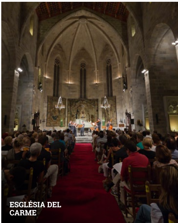
ESGLÉSIA DEL CARME