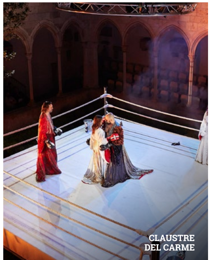
CLAUSTRE DEL CARME