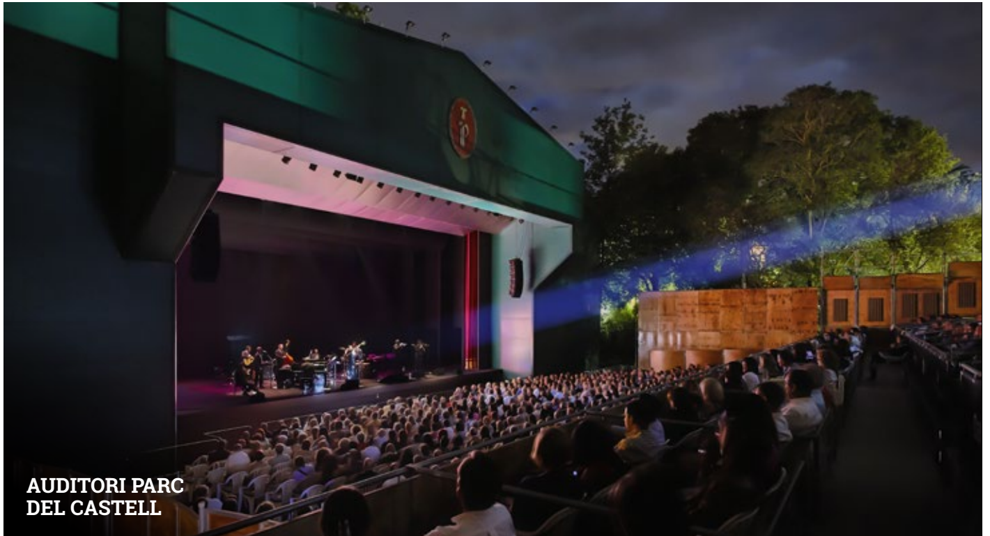
AUDITORI PARC DEL CASTELL